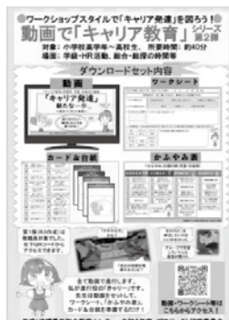
職員校内研修パッケージ