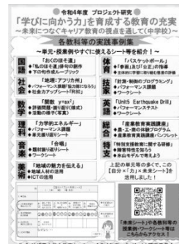
児童生徒学習パッケージ